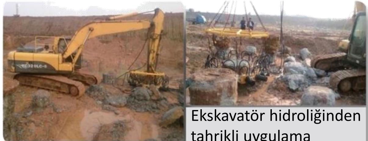
Ekskavatör hidroliğinden tahrikli uygulama