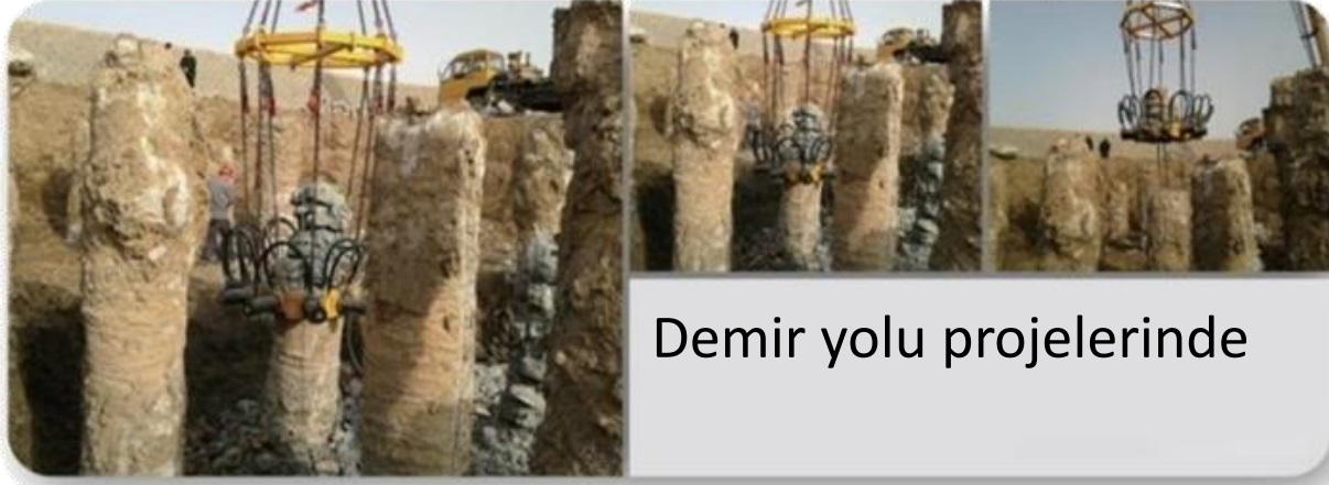
Demir yolu projelerinde