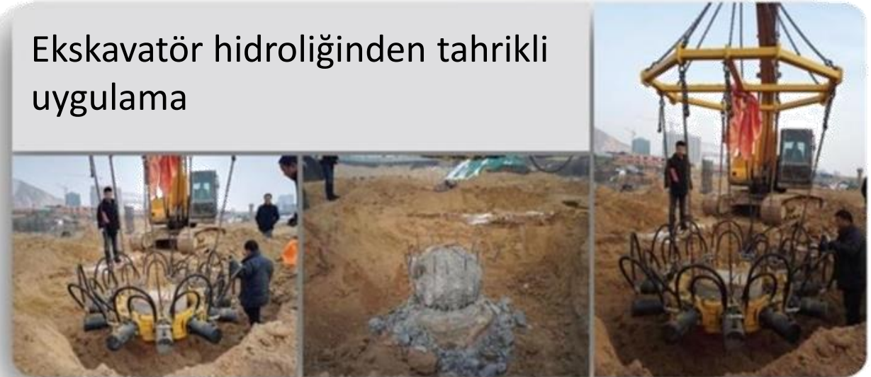
Ekskavatör hidroliğinden tahrikli uygulama