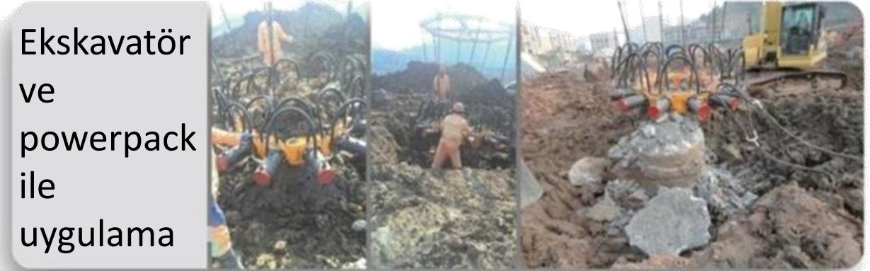
Ekskavatör ve powerpack ile uygulama