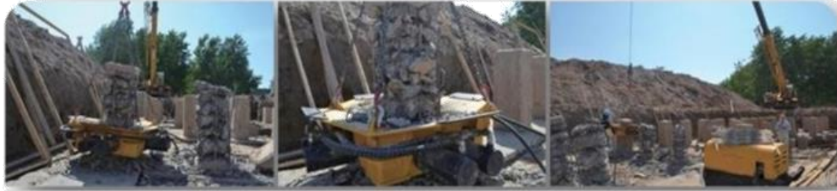
Vinçle ve power pack ile uygulama